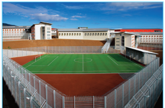
Centre pénitentiaire de Saint-Denis de la Réunion