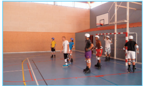
Établissement pénitentiaire pour mineurs de Marseille

Établissement pénitentiaire fondé sur une intense action éducative, un encadrement renforcé et un suivi individuel des mineurs.