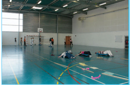
Maison d'arrêt de Lille Sequedin

Établissement pénitentiaire qui reçoit les prévenus et les condamnés dont le quantum ou le reliquat de peine est inférieur à 2 ans, ou les condamnés en attente d'affectation dans un établissement pour peine (centre de détention ou maison centrale).