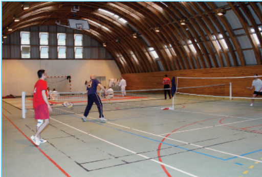
Centre de détention de Muret

Établissement pénitentiaire accueillant les personnes majeures condamnées qui présentent les meilleures perspectives de réinsertion. Leur régime de détention est orienté principalement vers leur resocialisation.